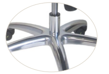
Aluminium base Base de aluminio