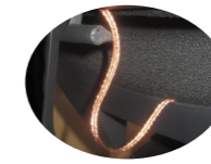
Detail of special wiring conducting Detalle conducción de cableado especial