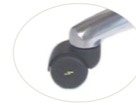
50 mm antistatic wheel Rueda 50 mm antiestática